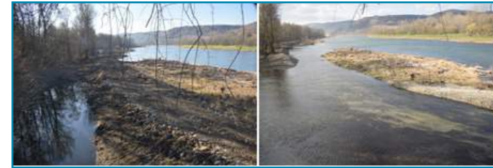
Evolution du paysage entre novembre 2016 (gauche) et mars 2017 (droite)

Début mars 2017, l'essentiel des casiers sont démontés. Le nouveau paysage prend forme : l'emplacement de l'ancienne digue devient un chenal isolant plusieurs îlots (dépôts de graviers qui existaient à l'avant de la digue). Le talus exposé suite au démontage de la digue est laissé abrupte : cette forme est celle qui existe naturellement dans les rives concaves des cours d'eau naturels. Elle facilite en outre la mobilisation d'alluvions lors de crues.