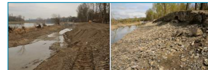
Effet de la crue de mi mars - 15 février (gauche) et 20 mars (droite)

Le chenal issu du démontage de la grande digue voit sa morphologie se diversifier.