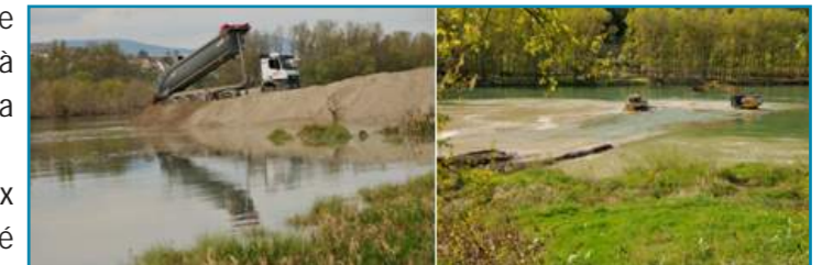
Réinjection de Graviers à l'amont du vieux Rhône : apport, puis mise en forme du dépôt